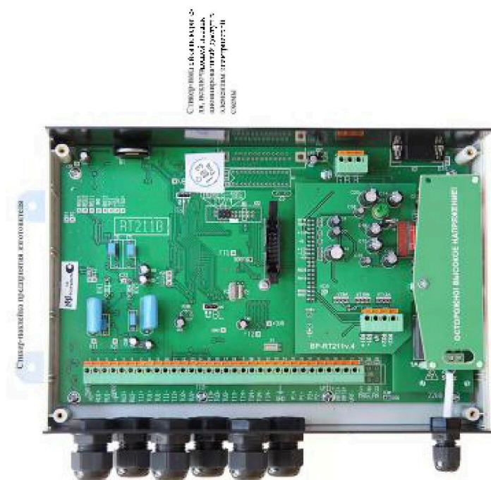
Место пломбирования регистраторов расхода Р приведено на рис.3.